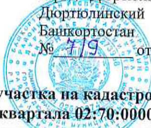
Схема расположения земельного участка на кадастровом плане территории кадастрового квартала 02:70:000000

Утверждена Постановлением городского поселения город Дюртюли муниципального района Дюртюлинский район Республики Башкортостан № 7/9 от « 10 » 07 2023